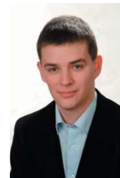
Glück auf! Marcus Faber